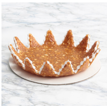
Assiette en croquant