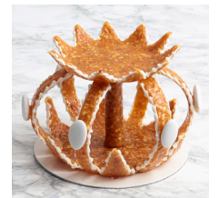
Couronne en croquant