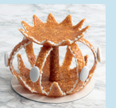
Couronne en croquant