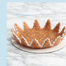
Assiette en croquant

*Toutes nos pièces montées contiennent des étages factices, permettant de leur donner de la hauteur ainsi qu'un bel aspect visuel.