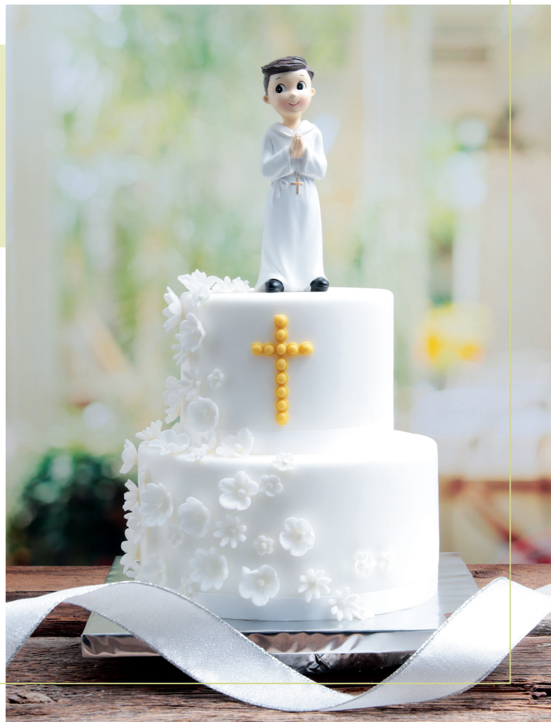
Décor en pâte à sucre, figurine non consommable.