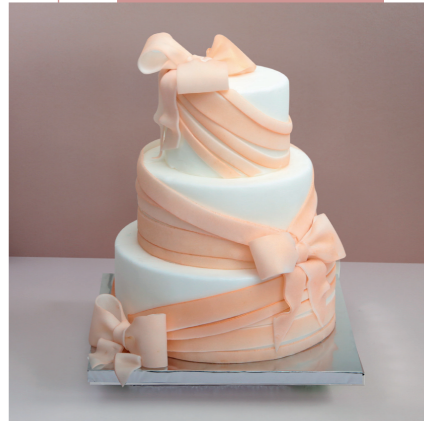
Décor en pâte à sucre.