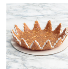
Assiette en croquant