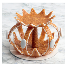
Couronne en croquant

Supplément Couple de mariés en chocolat blanc : 50,00 € uniquement sur pièce montée Amour Perlé