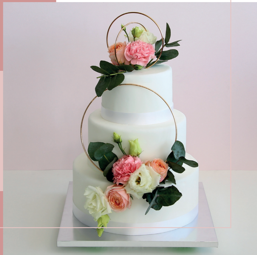
Flours fraîches et anneaux en métal doré.