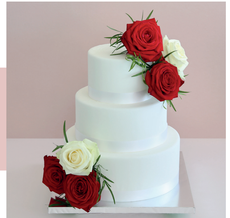
Décor en pâte à sucre et fleurs fraîches.