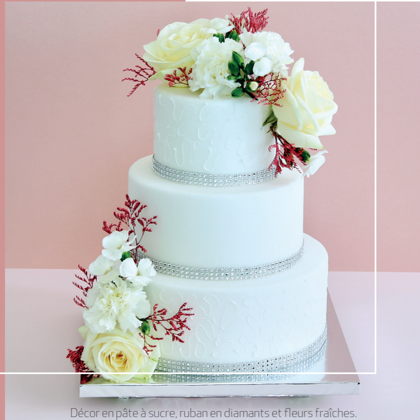
Décor en pâte à sucre, ruban en diamants et fleurs fraîches.